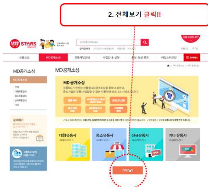
<그림6> 신청방법 2단계