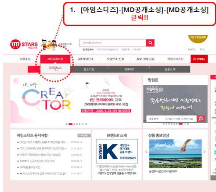
<그림5> 신청방법 1단계

1단계. 아임스타즈 홈페이지 접속( https://www.imstars.or.kr/ ) 후 MD공개소싱 클릭