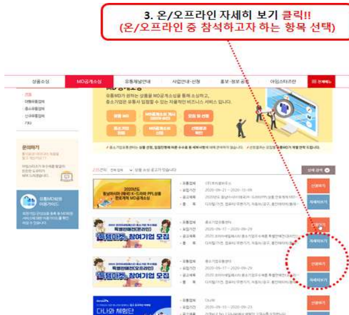
<그림7> 신청방법 3단계